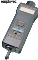
No modèle HF964 No fab K4010 Tachymètre à photo/contact

Accessoires compris: Roue de 3", un adaptateur pour cône, un cône en forme de cône, un cône entonnoir, un bout en forme entonnoir, une feuille d'étiquettes et un étui de transport.