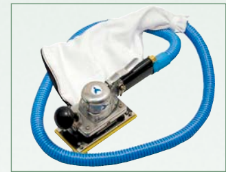
OS37SG Système récupérateur de poussière intégré