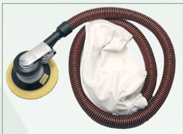
DA63SG Système de récupération de poussière intégré

Accessoires standards: Flexible résistant à l'écrasement, sac collecteur de poussière réutilisable, tampon de ponçage à 6 trous PSA de 6 po (905317)clés