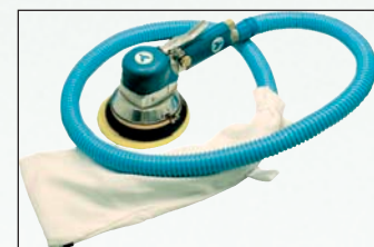
DA65SG Système récupérateur de poussière intégré