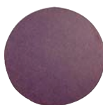
905310 Type PSA 6"