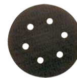
905317 Type PSA 6" avec prous d'aspiration